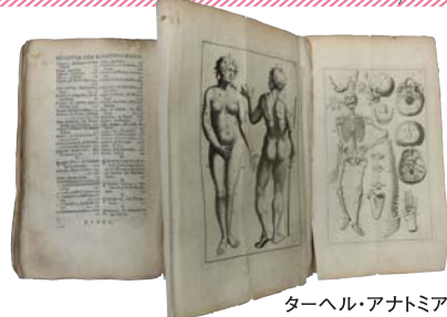
ターヘル・アナトミア