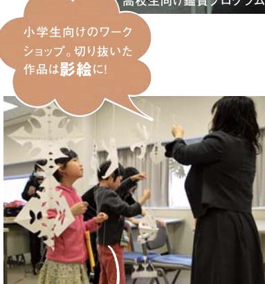
小学生向けのワークショップ。切り抜いた作品は影絵に！