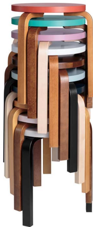
椅子《スツール 60》 アルヴァ・アアルト / 1933年 / アルテック ©Artek

一般1,200円 高校・大学生900円 ※前売・団体は各200円引き。 ※中学生以下は無料。