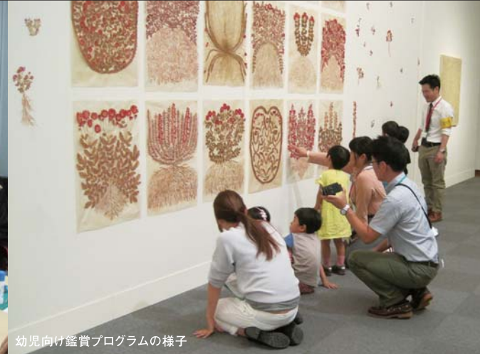
幼児向け鑑賞プログラムの様子