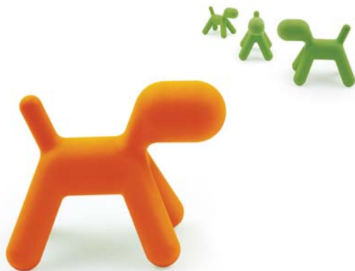
椅子《バビー》 エーロ・アールニオ / 2003年 個人蔵 ©Eero Aarnio