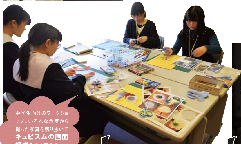
中学生向けのワークショップ。いろんな角度から撮った写真を切り抜いてキュビズムの画面構成を真似てみる。