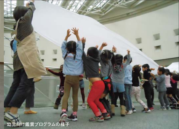
幼児向け鑑賞プログラムの様子