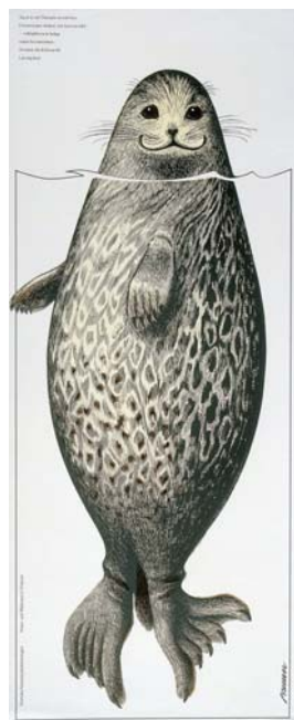
ポスター《サイマーワモンアザラシ》 (自然保護協会のポスター) エーリック・ブルーン / 1974年 作家蔵 ©Eric Bruun