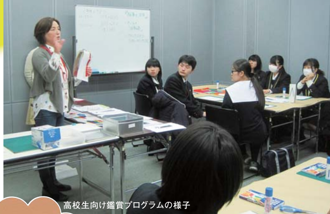
高校生向け鑑賞プログラムの様子