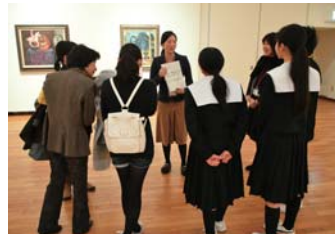
中学生向け鑑賞プログラムの様子