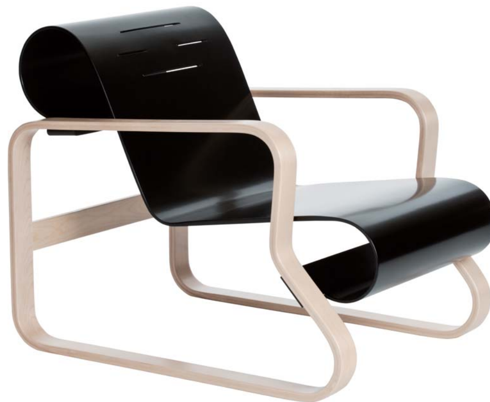
椅子《41 アームチェア バイミオ》 アルヴァ・アアルト / 1931-1932年 / アルテック 個人蔵

アアルトが設計したヴィープリ図書館の内装にも使われたスツール。極限まで無駄を削ぎ落とした3本脚のフォルムは、不朽の名作と称され、いまなお世界中で愛されている。形はシンプルだが、座面シートの色に豊富なバリエーションがある。積み重ねて収納できるなど、機能性も高い。