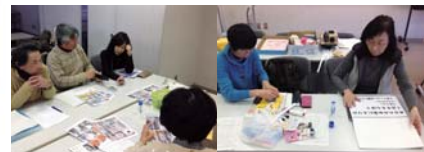
←学芸員と先生たちの打ち合せ・準備を取材。教員同士で真剣な議論も……