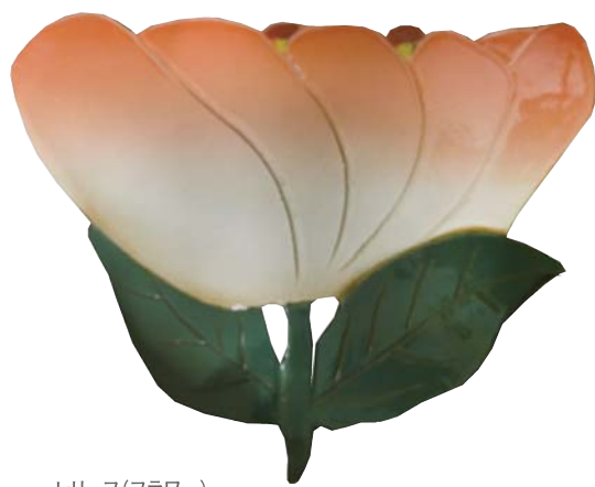
レリーフ(フラワー) 石本藤雄 / 2009年 / スコープ蔵 ©Fujiwo Ishimoto

ヘルシンキを拠点とする石本藤雄(1941-)は、1974年から2006年までマリメッコ社のテキスタイルデザイナーとして活躍。1989年からは並行して、フィンランドを代表する陶磁器メーカー、アラビアで陶芸作品を制作。工場で生産したり、職人に託したりせず、石本が一点一点を手がけている。